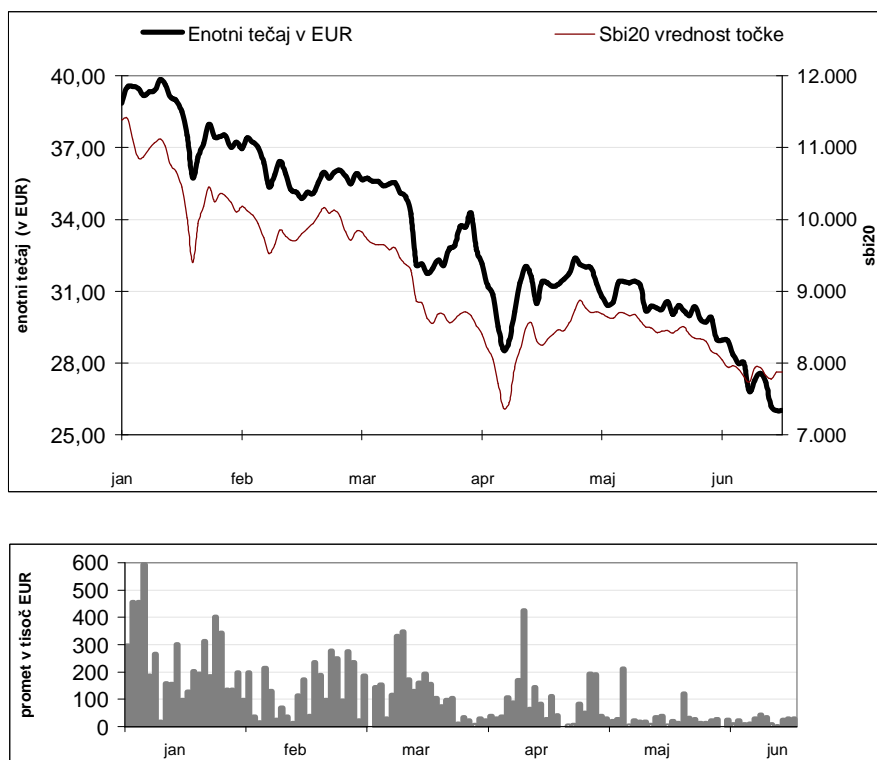
Slika 1: Gibanje enotnega tečaja in promet delnice IEKG in SBI20 v obdobju januar – junij 2008

Na borznem parketu je v prvem polletju promet z delnico IEKG znašal 13,5 mio € povprečni dnevni promet 0,2 mio €. Sklenjenih je bilo za 2.541 poslov.