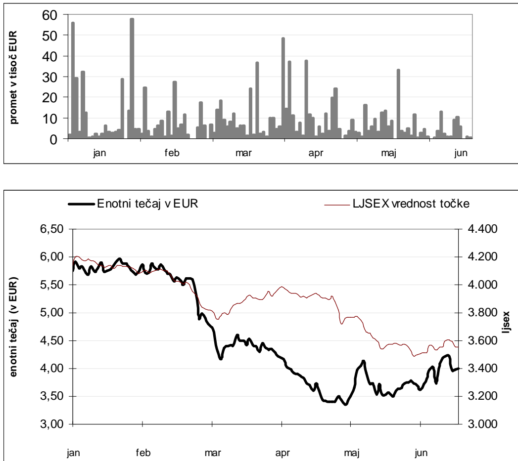
Slika 2: Gibanje prometa in enotnega tečaja delnice IEKG in indeksa LJSEX v obdobju januar – junij 2010

Enotni tečaj delnice IEKG se je v obdobju od 04.01. do 30.06.2010 gibal v vrednostnem intervalu od 3,35 do 5,96 € za delnico. Delnica družbe Intereuropa d.d. je v tem obdobju izgubila na vrednosti za -29,2 odstotka, borzni indeks LJ Composite -12,9 odstotka, indeks SBITOP pa -13,2 odstotka. Na dan 30.06.2010 je delnica IEKG zaključila kotacijo pri vrednosti 4,00 € za delnico.