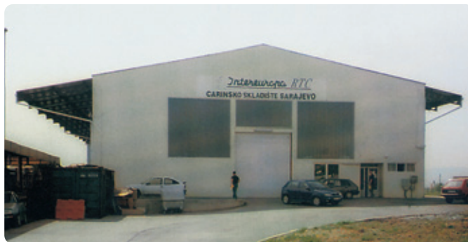
Naša najnovejša pridobitev: pokrito carinsko skladišče v Sarajevu.