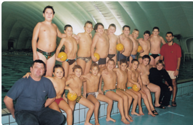
↓ Člani vaterpolo šole za najmlajše že uspešno sodelujejo na turnirjih in v mini vaterpolo ligi.