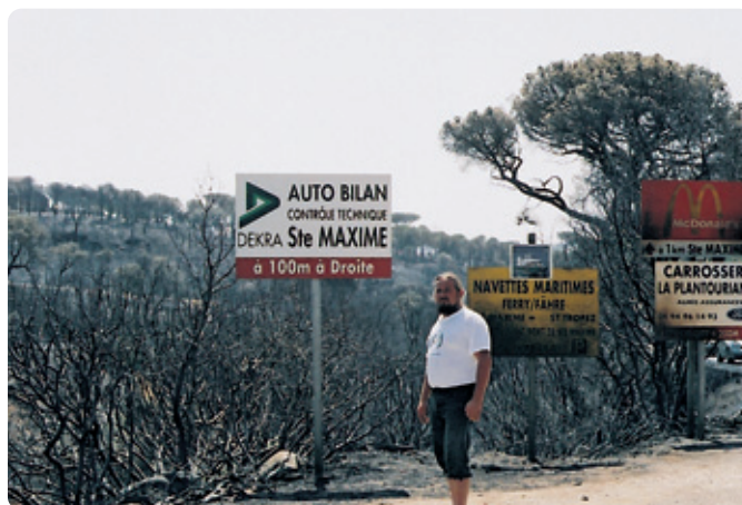
↓ Požar na Azurni obali mi je podaljšal potovanje. Tako žalostno je bila videti prej zelena pokrajina.

Nalog je prišel, da že zjutraj v kraju Sainte Maxime nalam kamine za Varaždin. Veselil sem se odhoda na Azurno obalo in za nameček še v najbolj romantično francosko pokrajino Provanso, za konec pa v razkošno Nico. Začelo se mi je zdeti čudno, ko sem prehitel nove in nove gasilce. Ko pa se je nočilo, se je vse bolj videl požar v pogorju Maures, kamor sem bil namenjen. Srečeval sem policijske avtomobile, civilno gardo ter počasnejše gasilske avtomobile in se naučil tudi novo francosko besedo "pompier" - gasilec. Policisti so zaprli naš izhod in nemočni smo dolgo v noč opazovali ognjene zublje, saj ogenj ni in ni hotel ponehati.