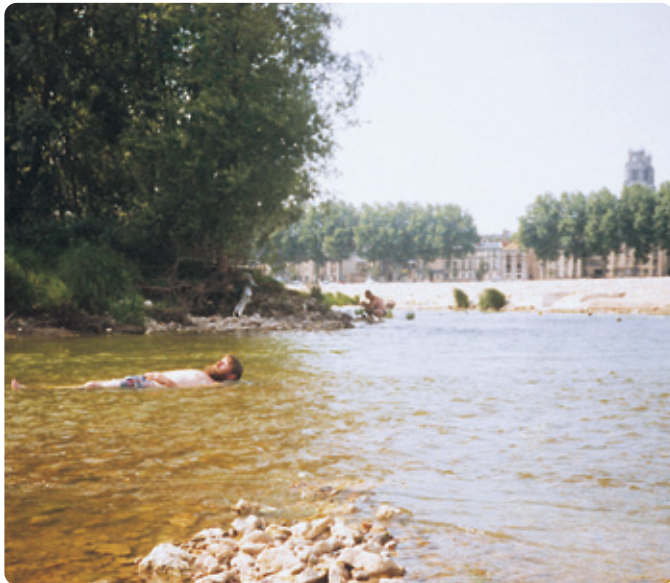
»Nihče me ne premakne!« Takšna ohladitev v času počitka je pravo razkošje.