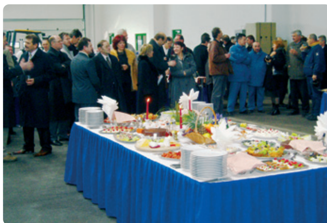
↓ Sproščen klepet in druženje ob zaključku dogodka.