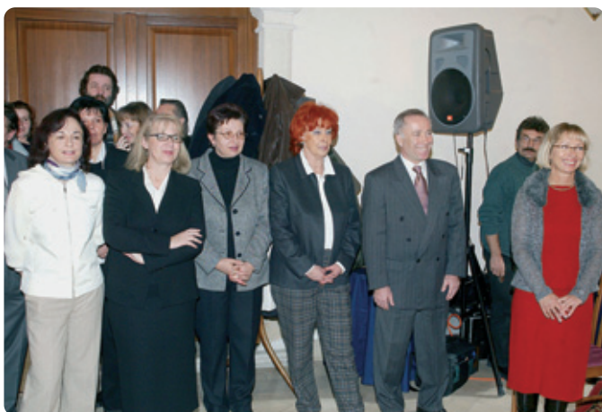
↓ Člani odbora na zaključni prireditvi.

Konec januarja se je v prostorih koprškega Circola uspešno zaključila velika humanitarna akcija Naj srce dolgo igra . Njen namen je bil zbrati potrebna sredstva za nakup novega ultrazvočnega aparata za srčno diagnostiko.