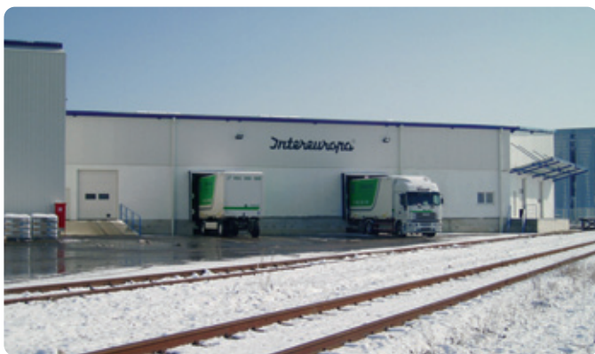
Do novega skladišča vodi tudi železnica.

V varaždinski podružnici smo do nedavnega razpolagali s skupno 7000 kvadratnimi metri zaprtega skladiščnega prostora. Pri uresničevanju vizije o preobrazbi iz klasičnega špedicijskega podjetja v ponudnika celovitih logističnih storitev se je izkazala