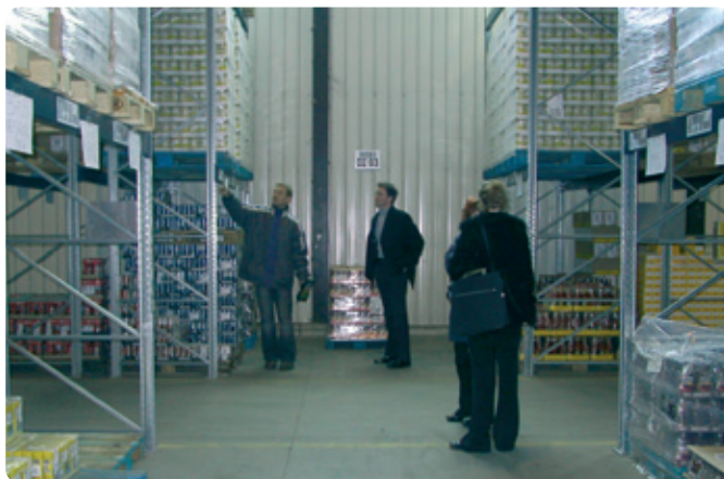
Pregledati je bilo treba vse podrobnosti.

Ena glavnih ugotovitev je bila, da je ta sistem za naša skladišča preveč rigorozen, saj je prilagojen predvsem proizvajalcem ter trgovcem. V sodelovanju z In-