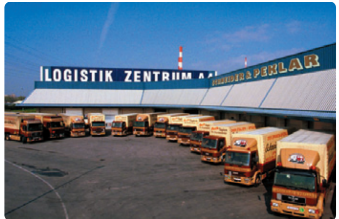
↓ Del voznega parka in osrednji logistični objekt družbe Schneider & Peklar.

V Užgorodu, ukrajinskem mestu na meji z Madžarsko, smo z dokapitalizacijo pridobili večinski delež v podjetju Zahidtransservis ali na kratko ZTS. S podjetjem in večino zaposlenih sodelujemo že vrsto let. Mlad kolektiv z visoko usposobljenimi kadri je še pred dobrimi tremi leti ust-