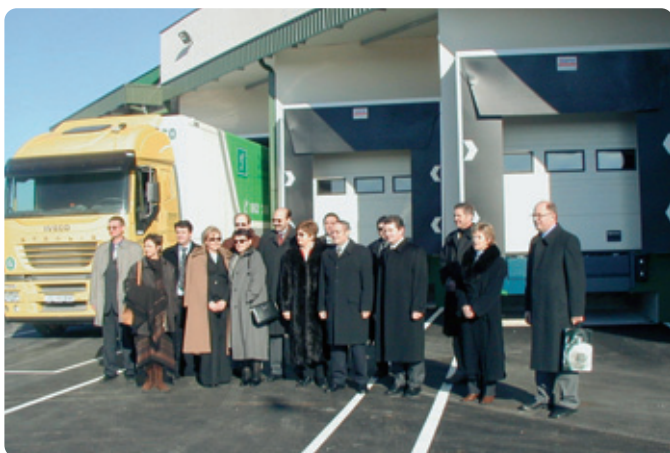
↓ Del Intereuropine ekipe pred dovozi za nakladanje in razkladanje.

V zadnjih mesecih se druga za drugo vrstijo otvoritve novih skladišč in logističnih zmogljivosti na Hrvaškem, ki smo jih pričeli graditi v lanskem letu. Enega večjih tovrstnih objektov smo 23. januarja odprli v Zadru.