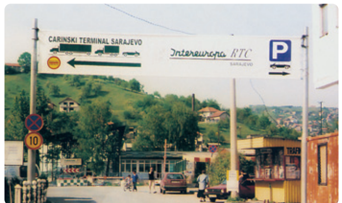
Naš vhod smo takole označili. V ozadju, med zelenjem, je videti novi del naše upravne zgradbe.