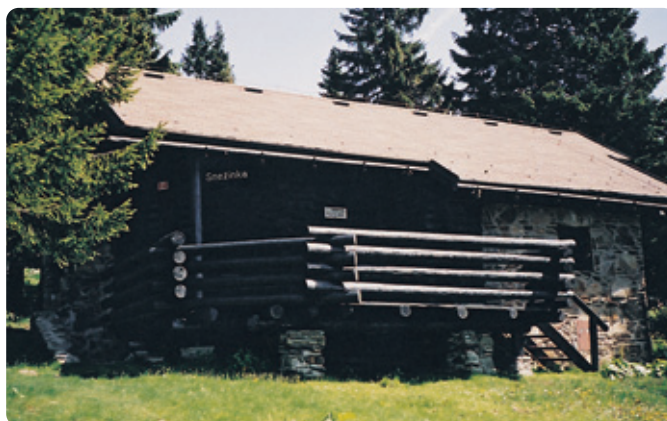
↓ Hiša Snežinka na Rogli.

V lanskem letu smo v naših počitniških enotah zabeležili 2.496 nočitev, le malenkost več kot leto pred tem. Razumljivo je, da je največ povpraševanja po apartmajih v času šolskih počitnic, okrog božiča in novega leta ter v poletnih