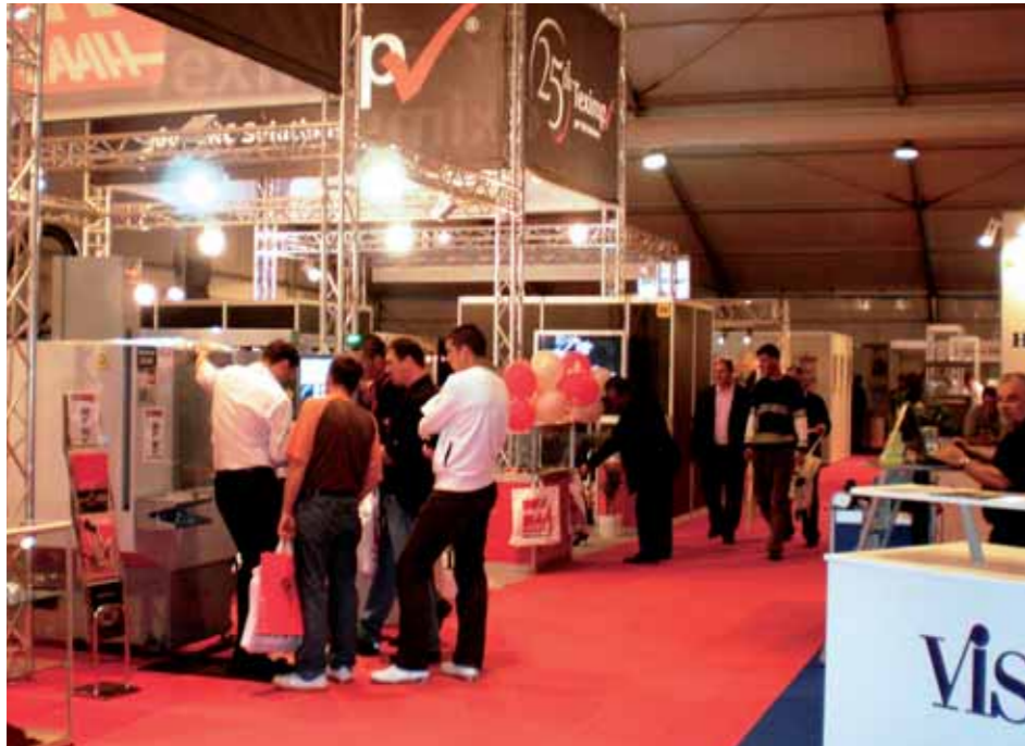
Izkazali smo se kot uradni špediter.