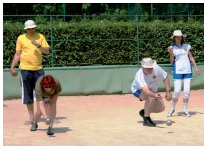
Med najbolj priljubljenimi disciplinami je vedno tudi balinanje.