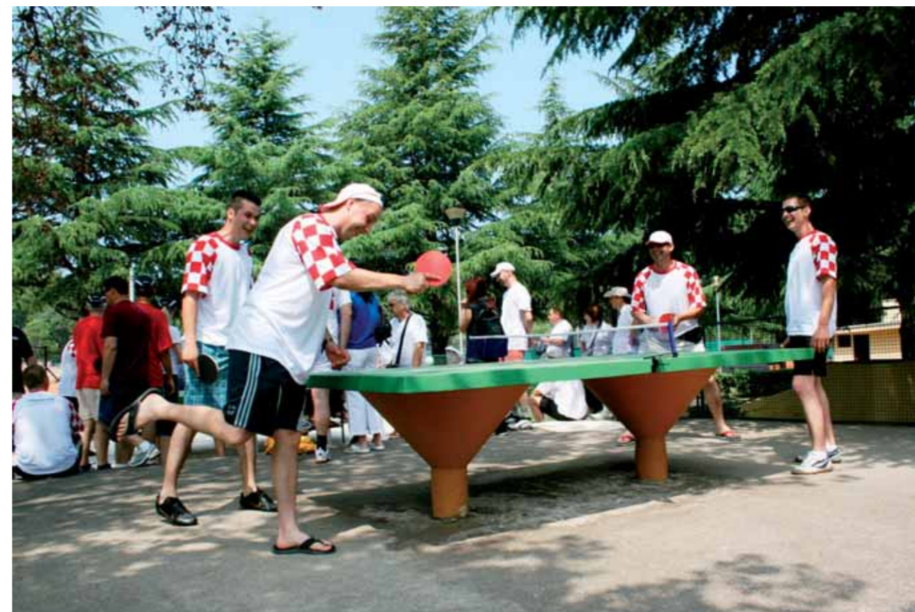
Namizni tenis je ogrel hrvaške kolege.

začela s pripravo zahtevne dokumentacije za uvrstitev te izjemne discipline na seznam naslednjih olimpijskih iger. Morebiti jim bo celo uspelo. Nekoliko odmaknjeno, vendar na prijetni lokaciji v senci borovcev, je potekalo prvenstvo v namiznem