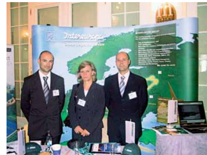
Naša predstavitev v Rusiji

V organizaciji Sektorja za marketing in razvoj ter britanskega podjetja Ultima Media smo se v začetku junija, od 3. do 5. junija, odpravili v ruski Sankt Petersburg na mednarodno konferenco avtologistike. 250 delegatov iz 25 svetovnih držav se je zbralo, da bi pridobili čim več koristnih informacij o enem od najhitreje rastočih in obetavnih svetovnih trgov z vidika avtologistike. Konferenco so obiskali predstavniki 140 podjetij, med katerimi so bila tudi številna svetovno znana imena na področju logistike in avtologistike, kot so Schenker, Gefco, Rail Trans Avto, RTL, NYK in mnogi drugi. Ultima Media je gostila najpomembnejše svetovne strokovnjake in predavatelje s tega področja, njihov namen je bil posredovanje znanja in izkušenj udeležencem konference. Tako smo se tudi mi udeležili številnih predavanj, okroglih miz in poslovnih diskusij, saj