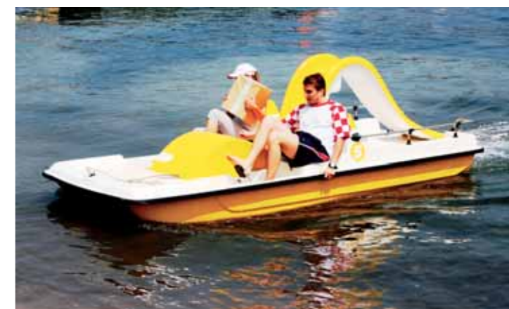
Morda bo logistična veriga kdaj tudi olimpijski šport.

začela s pripravo zahtevne dokumentacije za uvrstitev te izjemne discipline na seznam naslednjih olimpijskih iger. Morebiti jim bo celo uspelo. Nekoliko odmaknjeno, vendar na prijetni lokaciji v senci borovcev, je potekalo prvenstvo v namiznem