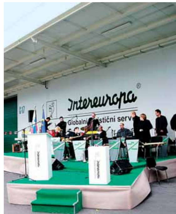
Pogled na novi objekt tik pred začetkom svečane otvoritve. Na odru je že pripravljen Celjski plesni orkester Žabe.

Anita Baraba Služba za odnose z javnostmi