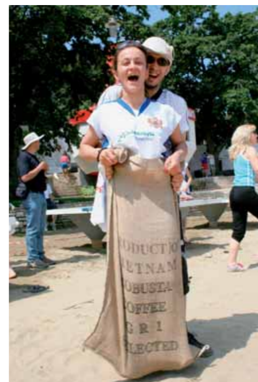
Poleg športa sta bila na prvem mestu zabava in dobro počutje.