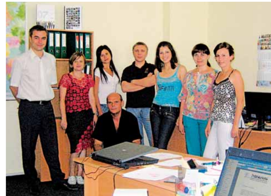
Ekipa naše ukrajinske družbe

proti koncu 18. stoletja in ima arheološki pomen. Arhitekturno je zasnovana v baročnem stilu, označuje jo razgibana zunanost s podobami golih žensk