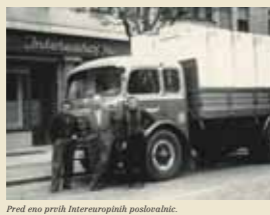
Pred eno preth Intereuropinih poslovalnic.

Strateški razvojni preskok je kmalu obrnilo sadove. V naslednjem desetletju se je Intereuropa povzpela med vodilna špedicijska podjetja v nekdanji državi.