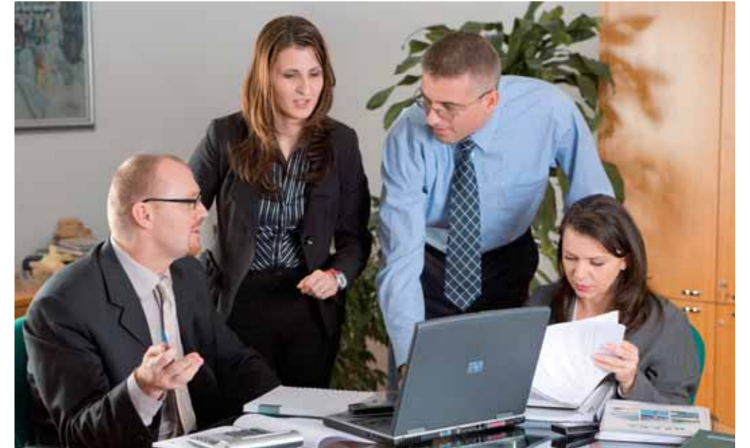
Delovni tim Intereurope Zagreb

Timsko delo je oblika aktivnosti, ki jo opravlja skupina na osnovi neposredne delitve nalog in ne glede na položaj posameznika v formalni hierarhiji. Koristno je predvsem takrat, ko so za uspešno reševanje kompleksnih nalog oziroma problemov nujni sodelovanje več zaposlenih, interdisciplinarni pristop in sodelovanje različnih profilov zaposlenih.