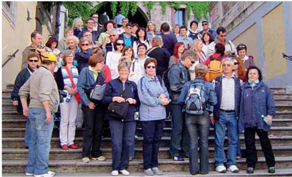
Člani sindikata na lanskem izletu v Rim.