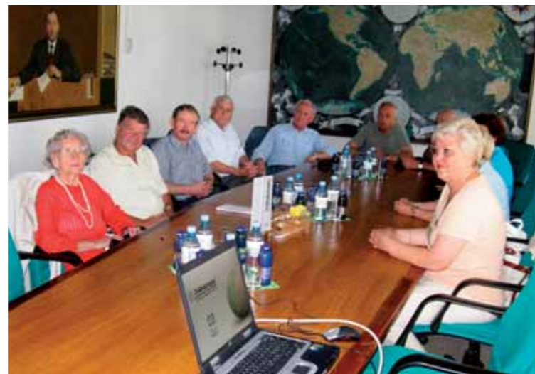
Upokojenci na obisku.

komentarjev in nasvetov, zaradi katerih se je njihov obisk razvil v skoraj kolegiju podobno živahno razpravo. Da pa se bodo obiska pri nas še dolgo spominjali, smo jim ob zaključku srečanja podarili monografijo