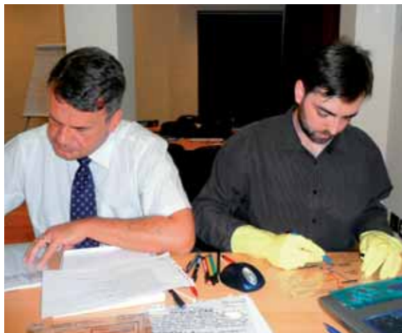
Pri opravljanju izpitov so člani tima na folije risali v rokovnicah, da so se izognili madežem in prstnim odtisom.

Prva priložnost za izmenjavo poklicnih izkušenj bo predvidoma že novembra, ko bo na Plitvičkih jezerih potekal Simpozij menedžerjev kakovosti. Do takrat pa bodo pridobljena znanja pomagala Intereuropi RTC d.d. Sarajevo pri še učinkovitejšem vodenju sistema upravljanja kakovosti. Omogočila ji bodo tudi ohranjanje ravni, zaradi katere je decembra lani pridobila certifikat ISO 9001, in pripravo za vzpostavitev drugih standardov kakovosti.