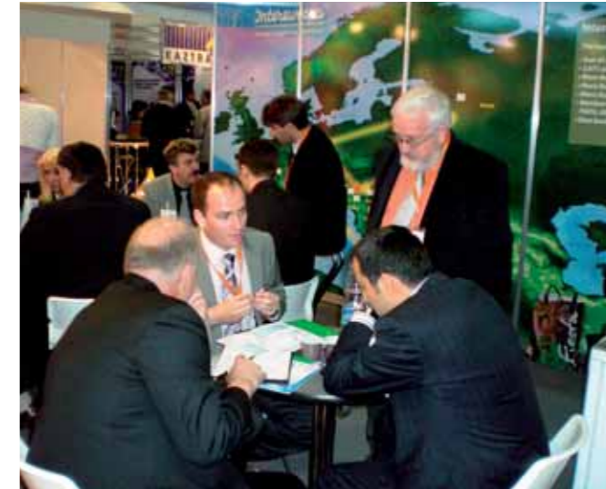
Naš razstavni prostor je bil na sejmu ves čas poln.

Aprila in junija sta bila za naš koncern z vidika predstavitve v tujini zelo pestra. Konec aprila smo se predstavili na mednarodnem transportno-logističnem sejmu v Moskvi, sredi junija pa še v kitajskem Šanghaju. Oba sejma sta bila zelo uspešna, saj sta bila naša razstavna prostora obakrat zelo obiskana, sklenili pa smo tudi številna nova poslovna poznanstva. Na sejmu Transrussia v Moskvi smo se predstavili prvič. Med 22. in 25. aprilom so se sejma v organizaciji Sektorja za marketing in razvoj udeležili predstavniki iz naših odvisnih družb Intereuropa – East in Intereuropa – FLG. Potencialnim strankam so predstavili vse prednosti, ki jih Intereuropa na tem trgu nudi. Na razstavnem prostoru so nas obiskala številna podjetja in špediterji, zanimivi pa smo bili tudi za veliko prevoznikov, ki se ukvarjajo s prevozi avtomobilov in jih zanima sodelovanje z nami. Največ zanimanja je bilo za naš novi terminal v Čehovu, saj se je vsem naložba zdelala odlična. Veliko je bilo tudi predstavnikov iz držav, kjer naš koncern nima svojih podjetij, kot so Španija, Portugalska, Nizozemska in Finska.