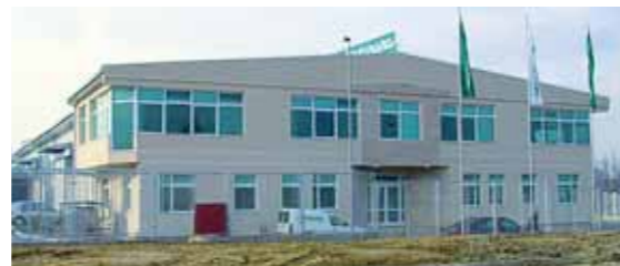
Intereuropa Skopje d.o.o.

Tako ima prehod veliko večji pomen od zgolj prometne povezave.