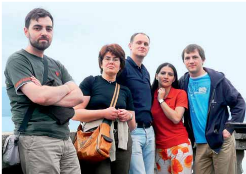
Med obiskom Vrbnika